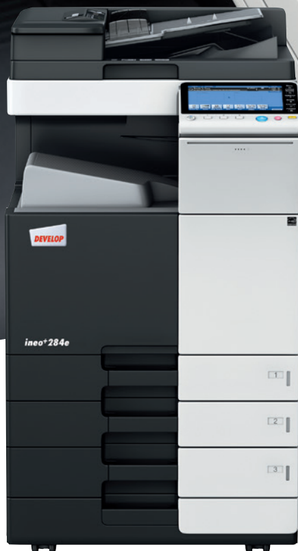
ineo+ 284e z podajnikiem papieru (PC-210) i podajnikiem oryginałów (DF-701)